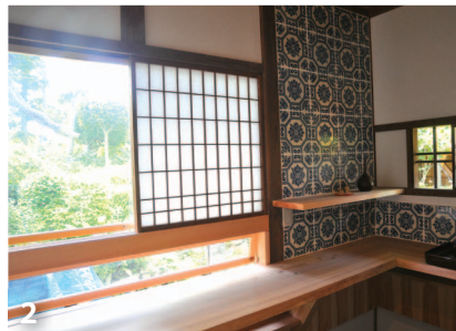
1. 完成した家と喜安さん 2. お風呂のタイルを活用した「離れ」の壁。デザインだけでなく、工事にも学生らが関わった