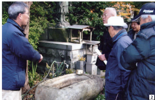
2 手水鉢 よく見ると石棺です。この辺りにはない石を使っています。どこから…?

7月11日(土)のふるさと歴史散歩は、「谷上山宝珠寺・福田寺・鎌倉神社へ行く!」。8時30分、松前庁舎南駐車場を出発。