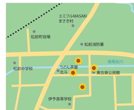
松前消防署南側、うどん茶屋北斗東側 伊予高校東側、東古泉公民館北側 (東古泉)