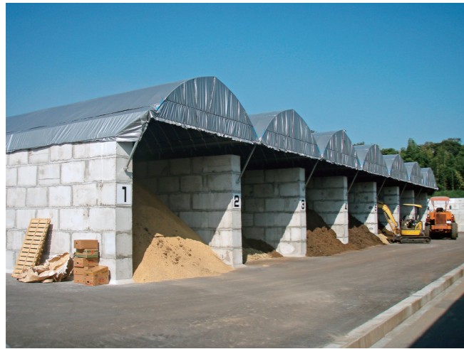
(南)あぐりのせんでい枝堆肥化施設