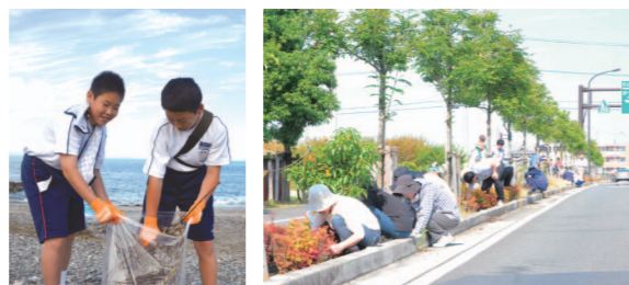
④塩屋海岸。子どもから大人まで多くの人が参加 ⑤北黒田海岸。国体啓発の軍手をつけて清掃する中学生 ⑥思い通り。西古泉住民 135 人が参加