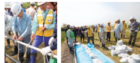
④協力し合い、手際よく土のうを作っていく ⑤「迅速・簡単・確実」を心掛け、ロープワークを進める ⑥土のうを積み重ね、浸水を予防する方法を学ぶ