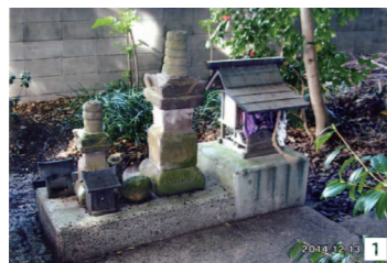
1 平若左近主従の供養塔 首なし馬が…

神社には、首なし馬の伝承がある平若左近と家来を祀る供養塔が移設されている。左近たちは出作の音地やぶで討たれたといい、地元の人たちが禅正軒庵で大念仏の行事を行い弔っている。先導が「大南無阿弥ロツパイ」と大団扇を持って音頭を取り、念仏の一区切りごとに人々は手に持った団扇を高く振り上げて拍子を合わせるのだ。何を話し合っ、この行事の形式ができたのだろうか。