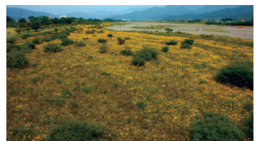
▲重信川に広がる様子

オオキンケイギクは、鮮やかな黄色できれいな花ですが、外来種で繁殖力が強く在来種に被害をおよぼす恐れのある特定外来生物に指定されています。 特定外来生物は、飼養・栽培・保管・運搬・輸入を行った場合、懲役3年以下もしくは300万円以下(法人の場合1億円以下)の罰金が科せられます。 持ち帰ったり、植えたりしないでください。