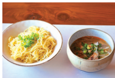
④審査会の様子。実際に調理したものを、審査員が 1 品 1 品その味を確かめていった ⑤表彰式の様子。白石町長から表彰状が授与された ⑥1 位に輝いた「松前つけ麺」