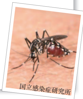
国立感染症研究所