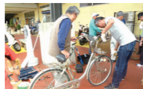
④自転車が適正な状態かアドバイスを受ける ⑤道路沿いで旗を持ち、運転者や歩行者に交通安全を訴える