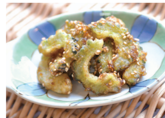
【エネルギー 113kcal (1人あたり)】