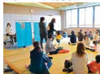
保健センター（3歳児健診）