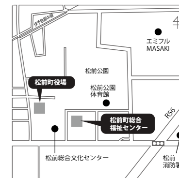
松前町総合福祉センター

松前町は、子どもたち一人一人の成長を適切に支援し見守り、「いいところ」を大事に伸ばす特別支援教育に取り組んでいます。偏りやつまずきのある子どもたちの成長を後押しするため、さまざまな機関が連携しています。困ったときは、ご相談ください。