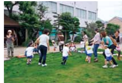
青々とした芝生の上で親子で遊ぼう

☎学校教育課 ☎985-4134 / 松前幼稚園(北黒田966-2) ☎984-1456 / 古城幼稚園(筒井1387-1) ☎984-2354