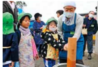
地域の人とふれあいながら「もちつき大会」