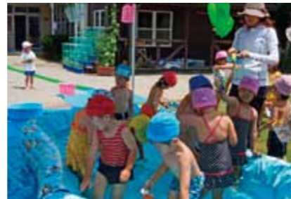
のびのびと表現しながら