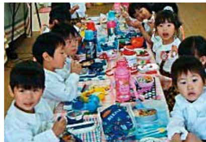
手作りお弁当はおいしいよ