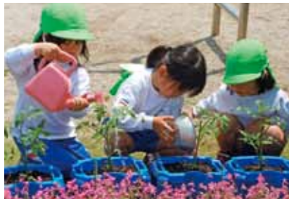
思いやりの心を育む野菜作り