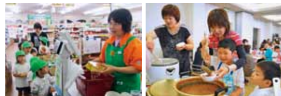
④パーティーでは「おいしい」の声がいっぱい ⑤カレーを買う4歳児 ⑥配膳も自分たちで