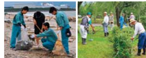
①徳丸コミュニティー広場を清掃する中学生 ②塩屋海岸の伊予農希少植物群保全プロジェクトチームと環境開発科1年生などが塩屋海岸で流されてきた流木などを拾い、持ってきていたごみ袋をすべて使い切りました