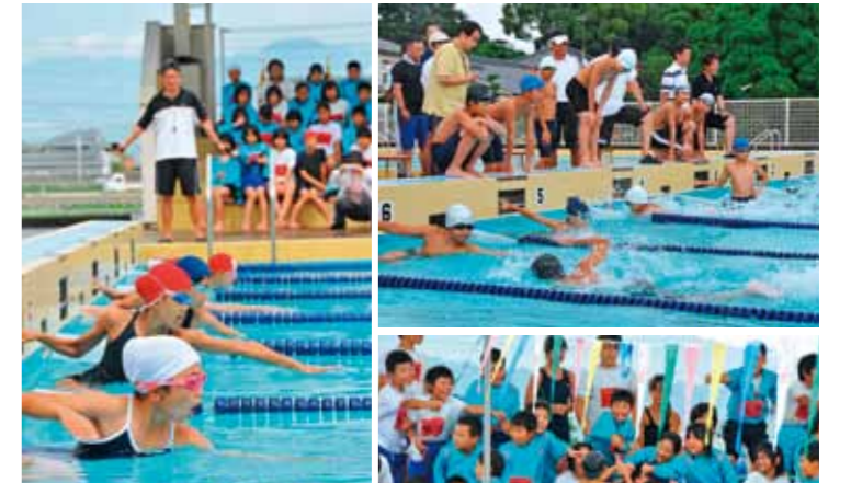
①最後の一かき一蹴りまで全力を尽くして ②緊張のスタート ③声を出し合い頑張ったリレー ④応援席では選手をタッチで迎え頑張りを称えました