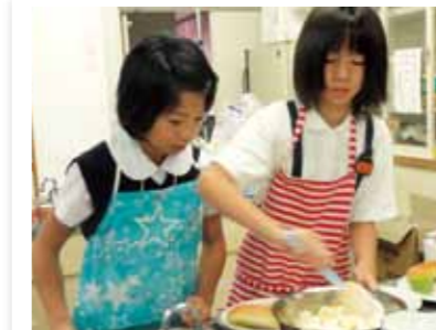
6時30分、みんなで分担して朝食作り！未来の名シェフを目指すよ！