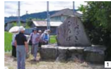
1 しのぎき広場碑 豪壮な篠崎謙九郎邸跡地。当時の写真も見せていただいた 2 横田公民館学習室 大勢の参加者が古文書を見たり、話を聞いたり、立ちたり、座りこんだり

ここが横田1番地だ。決まり通り横田の東南の角にある。藤原池とともに横田の貴重な貯水池であるが、堤防上から見る展望は素晴らしい。季節にはハスの花を観ることもできる。(松前史談 12号“横田部落散策”もご覧ください) 以下次号。