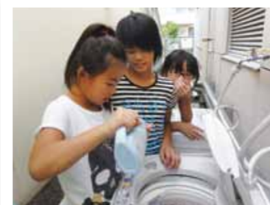
合宿所に下校すると掃除・洗濯・晩御飯洗濯は洗剤の分量に気を付けなくちゃね