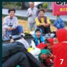
1_それぞれの立ち寄り所で、担いでは下ろし、担いでは下ろしを繰り返す神崎の大人みこし 2,3_東古泉の飲食店では周辺の複数の地区が獅子舞を披露し合った。かわいい子どもたちが大活躍(大溝・東古泉) 4_豪快な舞いを見せる横田の獅子 5_おみこしと一緒に記念撮影 6_獅子舞の激しい動きに観客は魅了された(上高柳) 7_大人と子どもの掛け合いが楽しい大溝の獅子舞