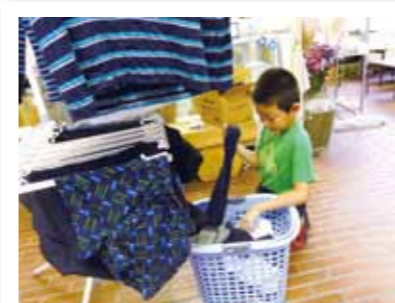
明日もいっぱいいっぱい新しいことにチャレンジするんだ！