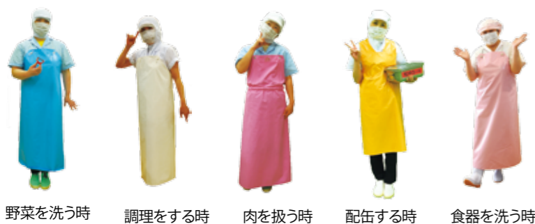
野菜を洗う時 調理をする時 肉を扱う時 配缶する時 食器を洗う時