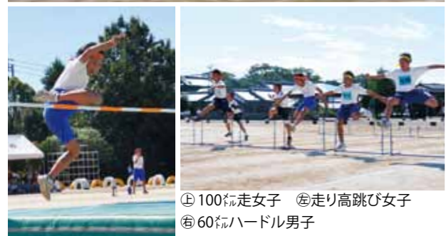
㊤ 100 m 走女子 ㊦ 走り高跳び女子 ㊧ 60 m ハードル男子