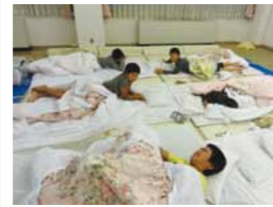
班メンバーで起こし合い、朝6時起床です！あと5分だけ…

松前小学校の4年生から6年生までの16人が、西公民館を合宿所として9月25日(日)から10月1日(土)まで、「まさきっこチャレンジ合宿」に挑戦しました。7日間も家庭を離れるのは、保護者にとっても子どもたちにとっても初めてのことで、不安と期待を抱きながら、16人のチャレンジャーによる7日間の共同生活が始まりました。