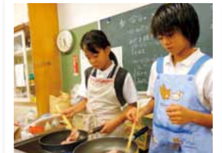
こんなに大変だったんだ…お父さん、お母さん、いつもありがとう