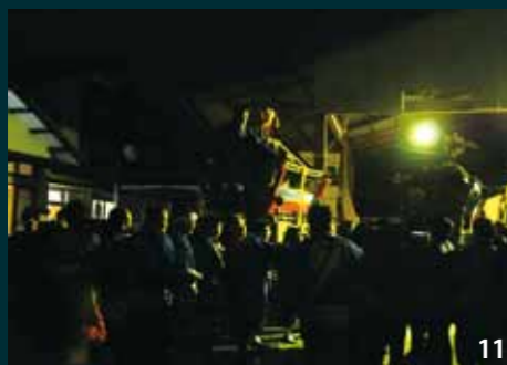
8_44年ぶりに大人みこしが復活(上高柳) 9_威勢のよい掛け声に合わせ、激しくぶつかり合う徳丸と中川原のみこし 10_そろいの法被で堂々とみこしを担ぐ子どもたち(北川原) 11_みこしの運行は朝早くから夜遅くまで続いた