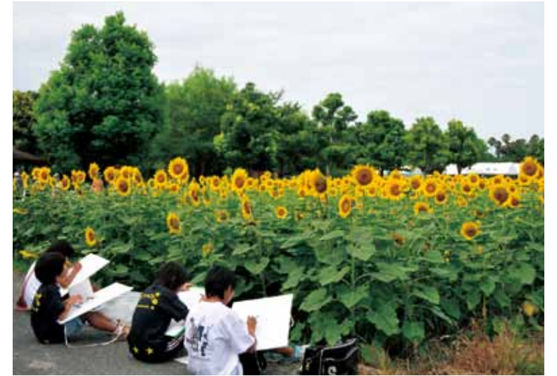
④写生大会に参加する子どもたち

魚のつかみどり大会では、公園横を流れる川をせき止め、魚が放流されると、子どもたちはスタートの掛け声とともに一斉に川に入り、水しぶきをあげて追いかけていました。