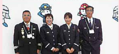
第15回 全国女性消防団員活性化岡山大会 隣の国おがやまから「安全・安心への駆け前」届けたい女性消防団員 平成31年11月9日(日) 松前アリーナ

に行かしてもろたんよ。全国で頑張っている女性消防団員の活動報告を聞いて、参考になったわ。