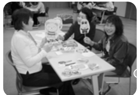
この日は、子どもたちの大好きなペープサートを作り、グループ別に演じましたが、役者ぞろいで楽しいひと時でした。学習会は他に、「子どもとあそび」、消防署での“救命講習”などがあります。

サポート会員を募集しています。子育てのお手伝いができる方、一緒に活動しませんか？