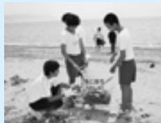
▲北黒田・新立海岸