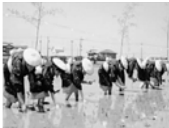
産業・経済振興・生活基盤の整備に活用します。