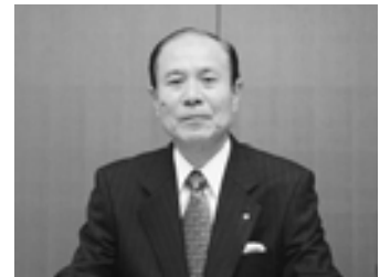
町長が寄附金の活用先を決定します。