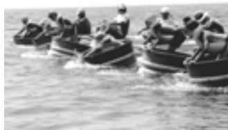
教育・文化振興に活用します。