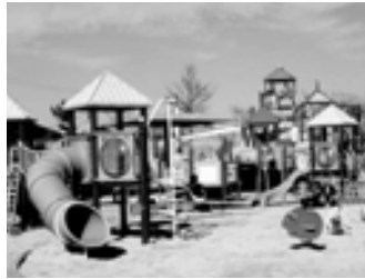
生活環境分野に活用します。