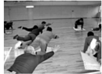
保健・医療・福祉分野に活用します。