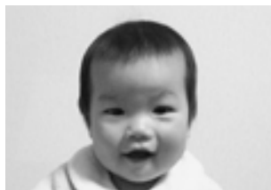
元気いっぱいのお姉ちゃんと仲良く遊ぼうね♡