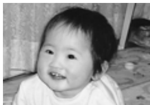
お姉ちゃんと一緒に元気に大きくなってね。