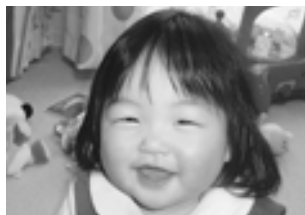
笑顔の素敵な人になってね♡