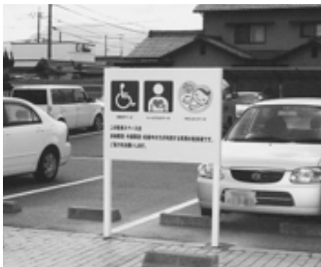
▲ハートプラスマークなどの表示のある 駐車場

駐車場看板にハートプラスマーク を表示 役場庁舎と福祉センターの障害 者専用駐車スペースにハートプラ