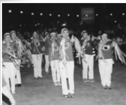
▲ピッタリそろった列と息