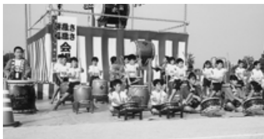
▲義農太鼓で祭りを盛り上げました

松前小学校からは義農太鼓、伊予万歳、金管バンドの皆さんが、北伊予小学校からは金管バンド、また岡田小学校からは伊予万歳、金管バンドの皆さんがそれぞれ演奏や演技を披露して祭りを盛り上げてくれました。