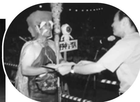
▲入賞おめでとうございます