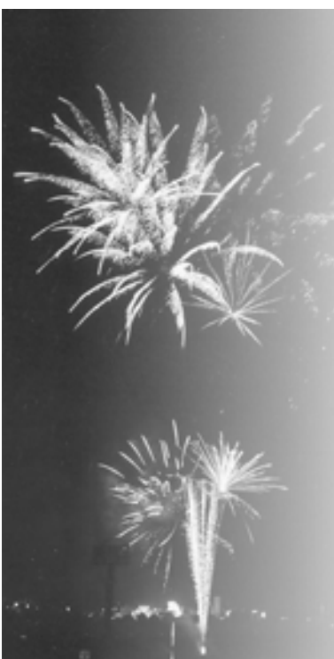
▲フィナーレを飾る大花火