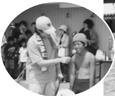
▶勝者インタビュー(ハア、疲れた)

今年は22連、約1,000人が、松前音頭を踊りました。各連、それぞれに趣向をこらしたパフォーマンスを披露するなど、参加者全員で踊りの輪を会場いっぱいにうめつきました。