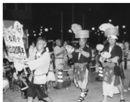
▲おたたさんもまさき音頭に参加?