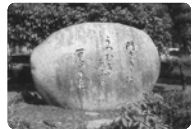
▲北伊予小学校思い出の庭にある子規の句碑