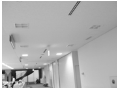
廊下などの間引き消灯