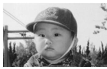
家族の宝物。これからもスクスク元気に育ってね！