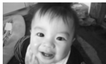
元気いっぱい！大きくなあれ♡