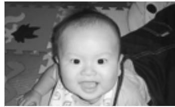
これからもかわいい笑顔たくさん見せてね♡