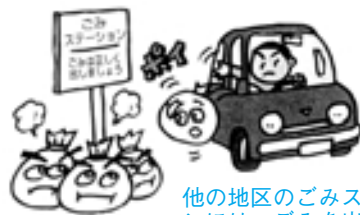
他の地区のごみステーションには、ごみを出さないでください。

収集日の朝7時ごろまでに出してください。 決められた日以外には出さないでください。