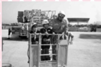
ボリースカウト 消防署見学(梯子車搭乘)