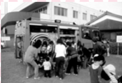
岡田保育所避難訓練