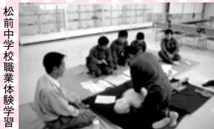
松前中学校職業体験学習