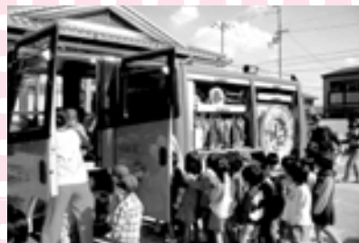
黒田保育所避難訓練