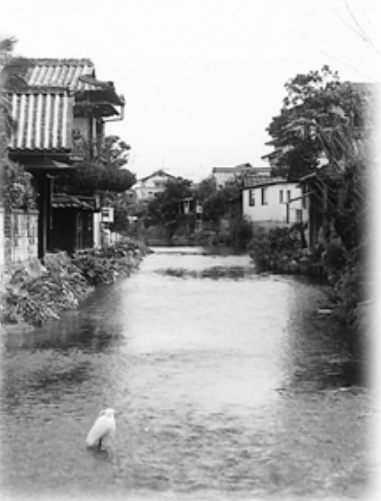
▲大間有明公園上流