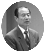
開会にあたり「白石町長」よりあいさつ