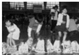
どれにしようかな

4月18日 大間 (運動会) 西高柳 (運動会) 上高柳 (レク/バレー ポール大会)