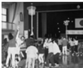
ねらい定めて、エイ!

運動会や球技大会など、和気藹々のうちに大きな行事を終えた分館、またもや天雨に休息を与えてもらった分館、など様々でしたが、今年もプラス思考で頑張りたいものである。なお、中学生の積極的な参加が見られた分館もあった。