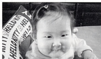
1歳のお誕生日おめでとう。 笑顔を忘れずに。