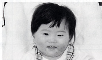
我が家のアイドル穰伎♡元気 にたくましく成長してね。