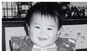
プリンセス唯ちゃんは、みんなの宝物だよ。