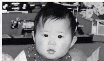
明るく、優しい女の子になってね。