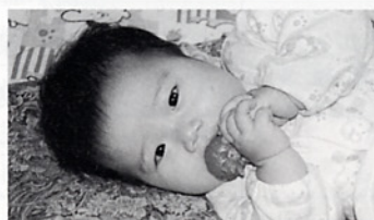
3人のお兄ちゃんお姉ちゃん がとても大好きです。