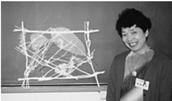
▶力作を前ににっこり