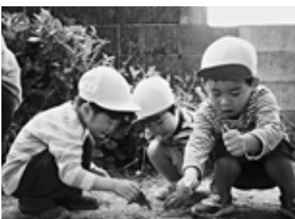
▲子どもの気持ちを一番に…

これからも、子どもたち一人ひとりの気持ちに寄り添い、温かい保育をしていきたいと思えます。