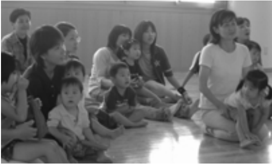
▲サポート会員の家族も一緒に参加した交流会風景

昨年7月、子育ての大変な時期、会員組織として、お互い助けたり、助けられたりしながら子育てを行っていきこうと「松前町いきいきサポートセンター『ma★ma・ほっと』」が発足しました。