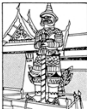
総務課秘書広報係

タイは敬虔な仏教国で、微笑みの国と呼ばれています。素敵な笑顔に出会える国に、この秋「まさき交流の翼」ではばたきませんか。皆さんのご参加をお待ちしています。