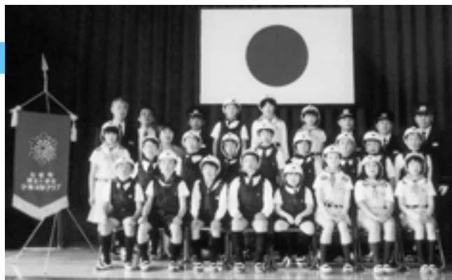
▲岡田小学校少年消防クラブの皆さん