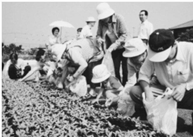
▲手に手に苗を持ち帰る皆さん