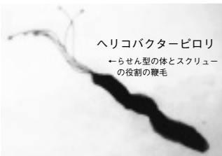
ヘリコバクターピロリ ←らせん型の体とスクリューの役割の鞭毛

検査をした結果、ピロリ菌感染がわかり、胃炎や胃潰瘍が再発しやすい方やなかなか治らない方には主治医の判断で除菌治療を行うことになりました。2種類の抗生物質と胃薬を使用して除菌するわけですが、これにより90%の方が成功することがわかっています。今まで言われてきたストレス、アルコール、タバコなどが頻繁に起こる方、治りにくい方は一度ピロリ菌感染を調べられることをお勧めします。