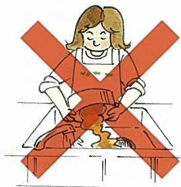
排水管の詰まりや悪臭の原因（家屋内に悪臭がたつ。）

※ディスポーザー（単体）を使用しないで下さい。下水道管の詰まりを引き起こします。