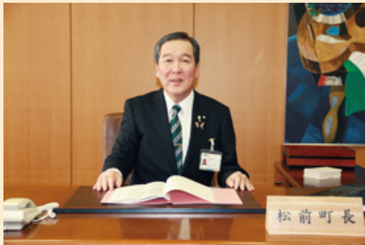
★本会議初日と最終日に、自身の思いを発信しました。

答 基本的に法定外公共物は所在する町が管理するものだが、一部負担の打診はしている。 問 委員会における請願採択の可否は、委員全員の慎重な審議が必要では。 答 事前の内容把握を深め審議する必要がある。前向きに検討する。