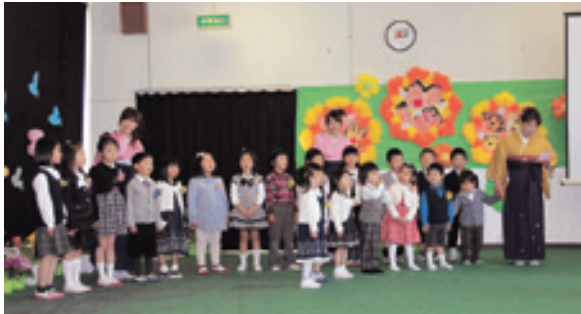
H25.3.23 終園おわかれ会より