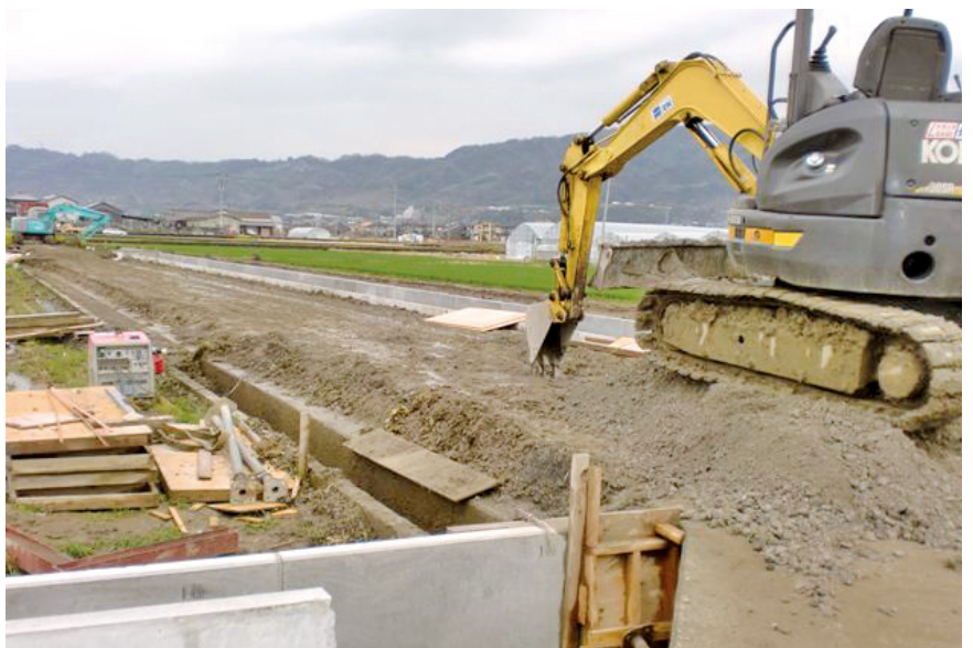
田中川改修工事でお色直し

答 田中川改修工事と、町道東170号線歩道設置及び北伊予西口歩道橋整備に係る測量委託業務などである。