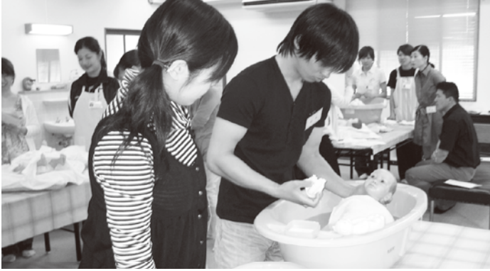
沐浴レッスン（親と子のすくすく相談事業）