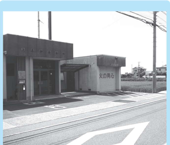
第7分団消防施設整備