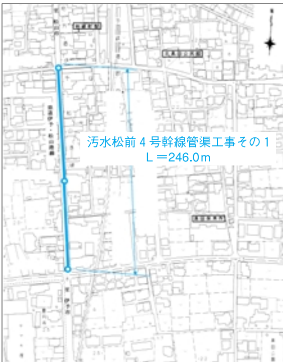
汚水松前4号幹線管渠工事その1 L=246.0m