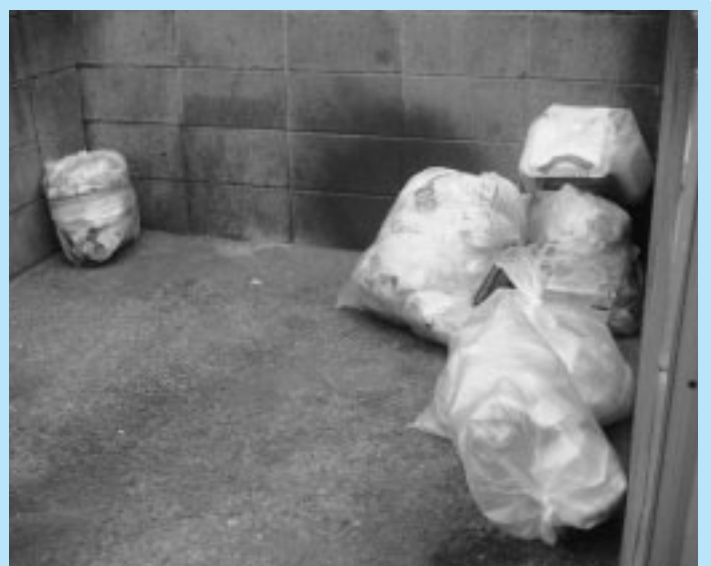
可燃ごみ「指定ごみ袋制度」導入