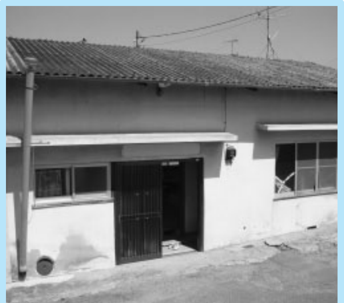
岡田校区放課後児童クラブ施設建設