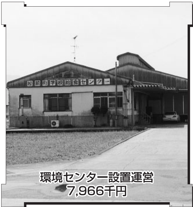
環境センター設置運営 7,966千円

平成16年3月議会は、3月5日に召集され16日までの12日間の会期で開催されました。 本議会には、平成15年度一般会計補正予算(第6号)・平成16年度一般会計当初予算など予算案件10件、条例案件7件、その他議決案件18件、合計35件の議案が提案され慎重審議の結果、いずれも原案の通り可決されました。 今年度の一般会計は、三位一体改革により税源移譲を大幅に上回る国・県支出金や普通交付税の減額が見込まれており、非常に厳しい財政状況ですが、教育施設や高齢者福祉施設の整備、道路や排水路の改良等生活関連社会資本の整備など、第3次総合計画の実現に向けた重点課題に対して、重点的な財源が確保されています。 また6名が一般質問に立ち、町政全般にわたって理事者の考えをいただきました。