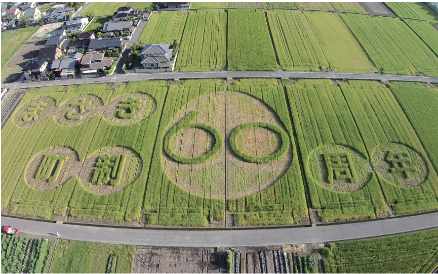
㊦はだか麦アートの全景 ㊧麦を刈ってアートを完成させていく伊予農生の皆さん ㊨完成した麦畑の中で、手を振って喜ぶ伊予農生たち