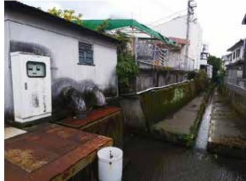
★現在の早船川排水機場付近