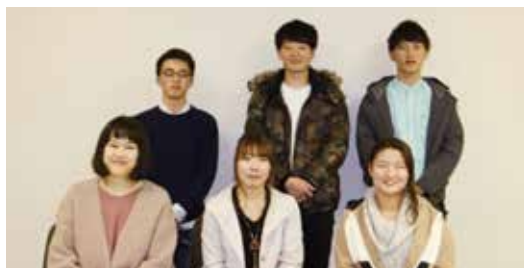
実行委員さんへ Q&A 方式で取材