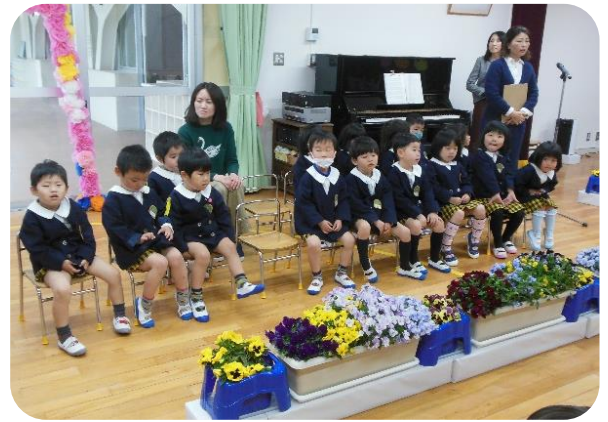
明日から楽しみだね。