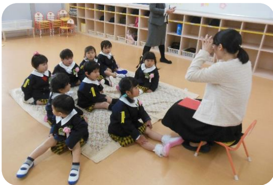
たんぽぽ組のお部屋だよ。

新入児12名の友達を迎え、51名の子どもたちとの生活がスタートしました。新入児さんの笑顔も見えて和やかな雰囲気の中、入園・進級を祝いました。