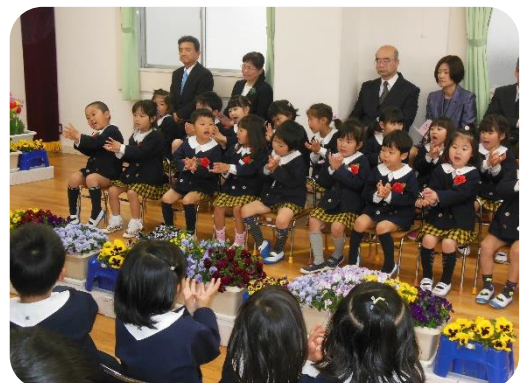
みんなでチューリップの歌をうたおう。