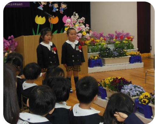
年長のお兄さん・お姉さんがお祝いの言葉を言ってくれました。