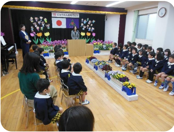
園長先生の話静静地に聞きました。

新年度が始まりました。子どもたちは春休みが終わり友達に会えて喜んでいました。始まりの式では、ひとつ大きくなった喜びに胸を膨らませていました。