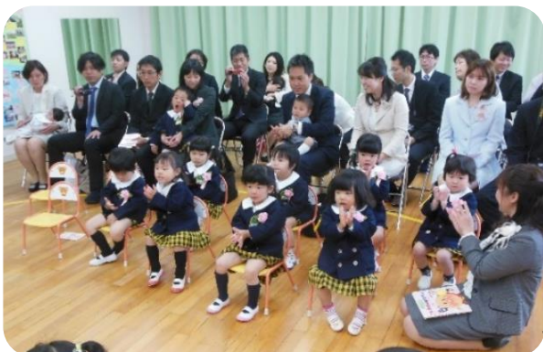
お家の人近くにいるから安心するね。