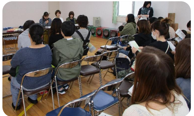
PTA総会では、園と家庭が協力して活動できるよう話し合いました。