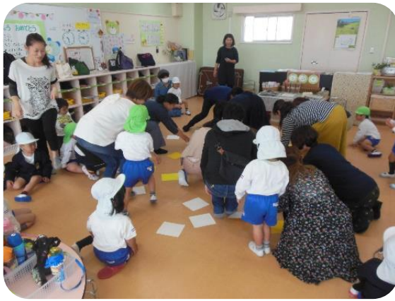
親子でチームに分かれてカードをめくるゲームをしました。どちらのチームの色が多いかな。