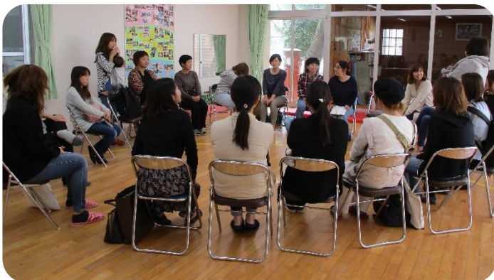
クラスに分かれての保護者会が行われました。