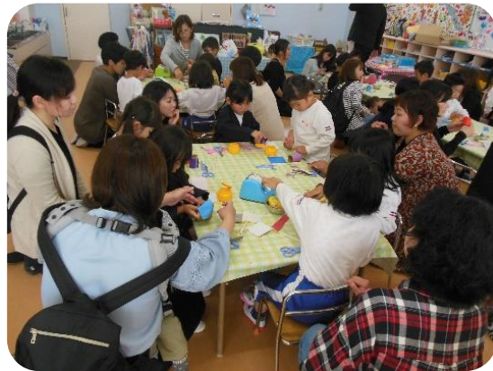
お家の人と一緒にロケットを作りました。