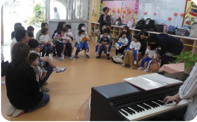
幼稚園で初めての参観日、お家の人前で「はーい」と上手に返事できました。

今年度初めての保育参観を行いました。お家の人と触れ合いながら、楽しい時間を過ごしました。その後、PTA総会を行い、今年度の活動について話し合いました。