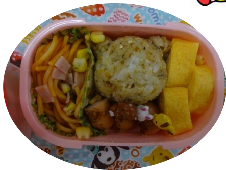
「ママがたまごやき 作ってくれたよ」