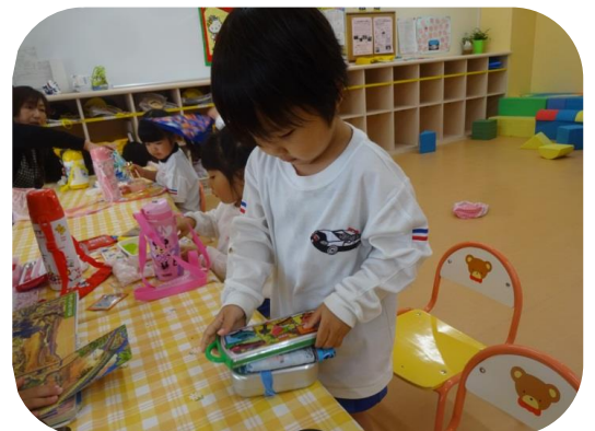
準備や片付けも自分でしてみよう。