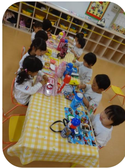
みんなで食べるとおいしいね！