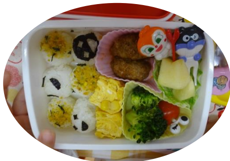
「まんまるのおにぎりが かわいいでしょ！」