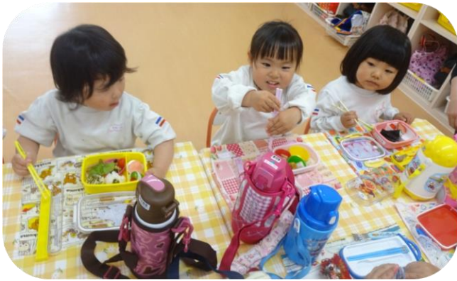
お弁当、お弁当、うれしいな♪