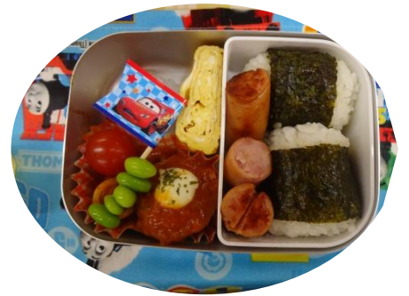
「ママのおにぎり大好き♡ 早く食べたいな」