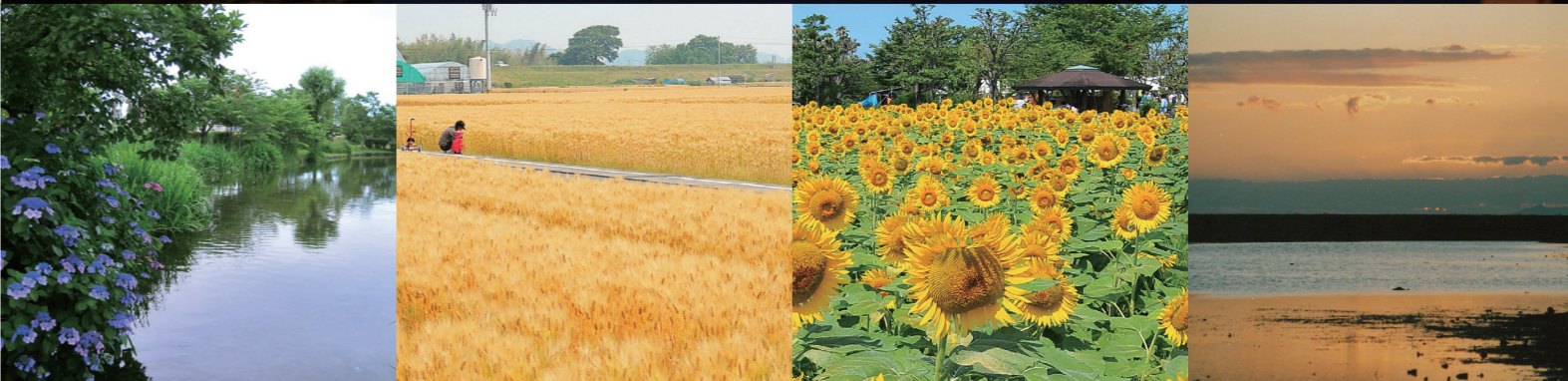
有明公園(灯籠流し)