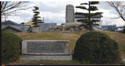
松前城跡 (昭和44年3月 町史跡指定) 9 MAP

この城のはじめは定かではないが、1595年、加藤嘉明が6万石で松前城に封ぜられた。その後、慶長の役の功により10万石、更に関ヶ原の戦の功により20万石に増された。しかし、この地は戦略上不利な点が多く、1603年、松山城を築いて移った。大正14年、破壊されていく城跡を憂い、「松前城跡」という碑を建て、松前城の歴史を略記した。