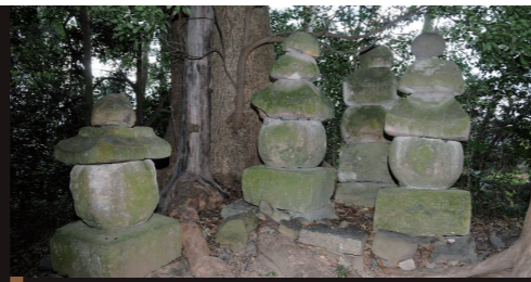
五輪の塔 (昭和44年3月 有形文化財指定) 10 MAP

この城のはじめは定かではないが、1595年、加藤嘉明が6万石で松前城に封ぜられた。その後、慶長の役の功により10万石、更に関ヶ原の戦の功により20万石に増された。しかし、この地は戦略上不利な点が多く、1603年、松山城を築いて移った。大正14年、破壊されていく城跡を憂い、「松前城跡」という碑を建て、松前城の歴史を略記した。